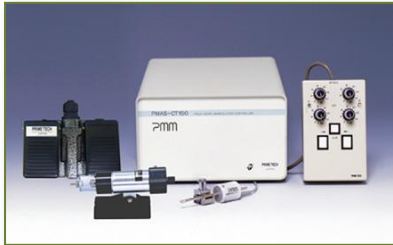
↑ ピエゾ駆動式マイクロマニピュレータ 【PMM-150HJ】