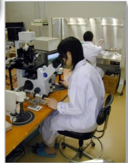
↑ 技術普及の為に研修施設 PMMトレーニングセンター 【ミニラボ】