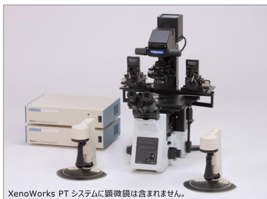
XenoWorks PT システムに顕微鏡は含まれません。

XenoWorks PT は、弊社ミナラボに常設し、研修コースでのマニピュレーション実践に使用しています。また、訪問デモンストレーションも随時受け付けておりますので、興味をお持ちの方は、お気軽にお問い合わせください。